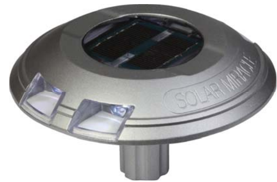
• MS-708 DSW